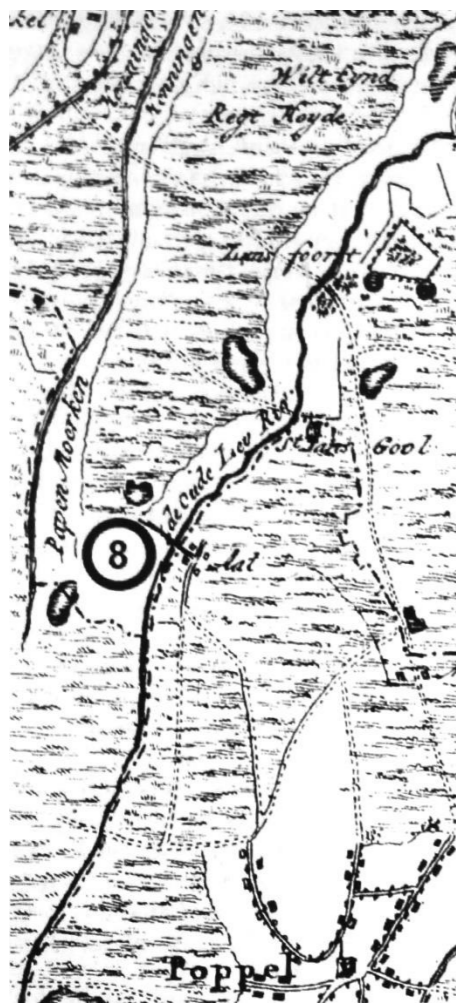
Afbeelding 2. Tolpunt te Aarle, voor het verkeer van Tilburg naar Poppel.

9. In 1637 werd verklaard dat in Tilburg altijd pachters of collecteurs van de heer van Drunen hebben gestaan, maar dat sedert een aantal jaren daar geen collecteurs aangesteld zijn geweest, vanwege een akkoord dat de inwoners van Tilburg en Goirle met de heer van Drunen gesloten hebben. 46 In 1611 werden de inwoners van Tilburg en Goirle vrijgesteld van de tol. 47 Waar in Tilburg die collecteurs hun tol inden, is uit de geraadpleegde gegevens niet of te leiden.